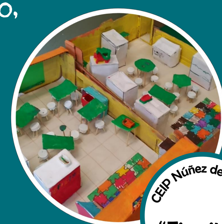
CEIP Núñez de Arenas "Firmitas"